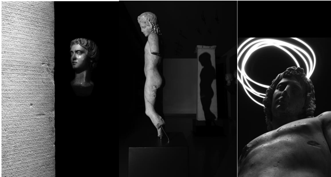
Η φωτογραφική έκθεση "Μνήμης αποτύπωση: πλάθοντας μορφές με ένα κλικ"