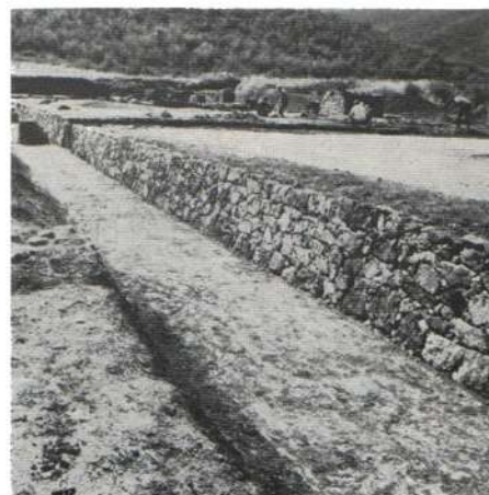
α. Τὸ ἀνάκτορον Βεργίνης, ἐκτὸς τοῦ Α. ἄκρου. Ἀριστερὰ αἱ τρεῖς αἰθούσαι Μ 1 , Μ 2 καὶ Μ 3 . β. Τὰ δωμάτια τοῦ Δ. τμήματος (Μ 1 καὶ Μ 2 ), γ. Τὸ στόμιον τοῦ φρεατίου τῆς αἰθούσης Μ 2 , δ. Φρεάτιον αἰθούσης Μ 3 , ε. Β. πλευρὰ τοῦ ἀνακτόρου, ζ. Ἀνάλημμα Δ. αἰθουσῶν

Μ. ΑΝΔΡΟΝΙΚΟΣ, Χ. ΜΑΚΑΡΟΝΑΣ, Γ. ΜΠΑΚΑΛΑΚΗΣ