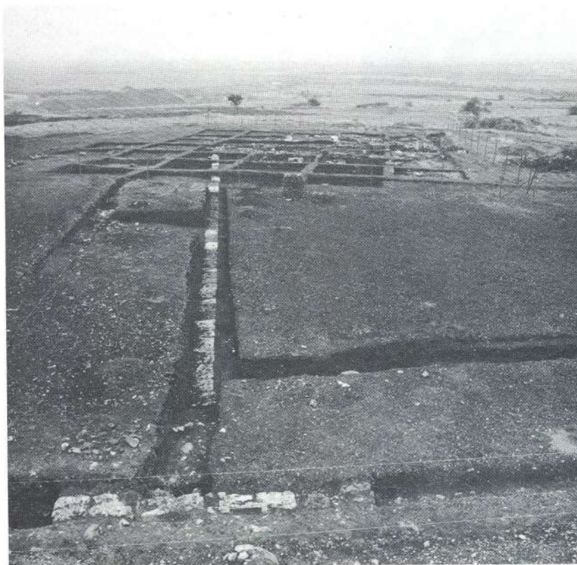
7. Τα κτίρια KIV και KII από τα δυτικά. 8. Το κτίριο KIV από τα νότια.