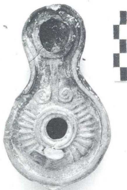
9. Κτίριο ΚΙΙΙ, Αtrium, ανασκαφή 1986. 10. Δύο λυχνάρια που βρέθηκαν στο στρώμα καταστροφής του ΚΙΙΙ. 11. «Στυλοβάτης» της στοάς ΚΙV και αγωγός Α2.