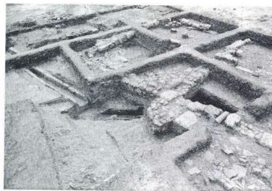
1. Αιγές. Άποψη της ανασκαφής από τα βόρεια. Διακρίνεται ο πώρινος αγωγός A1, το κτίριο KI και το KIII με το Atrium. 2. Αγωγός A1 και κτίρια KI και KIII από τα βόρεια. 3. Αγωγός A1, αγωγός A2 και κτίριο KII από τα βορειοδυτικά.