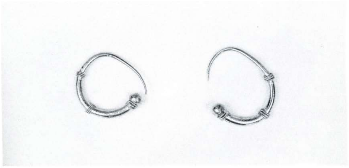
1. Βεργίνα. Ληκύθια από ταφές του 4ου αι. π.Χ. 2. Χρυσά σκουλαρίκια από ταφή του 4ου αι. π.Χ.