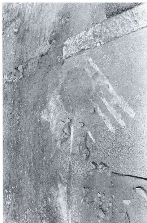
1. Οικόπεδο Κωστογλίδη. Αρχαίος λακκοειδής τάφος. 2. Το οικοδόμημα του 4ου αι. π.Χ. από τα νότια. 3. Ο χώρος Α με το βορραλωτό δάπεδο. 4. Βόρεια προέκταση του οικοδομήματος του οικοπέδου Κωστογλίδη.