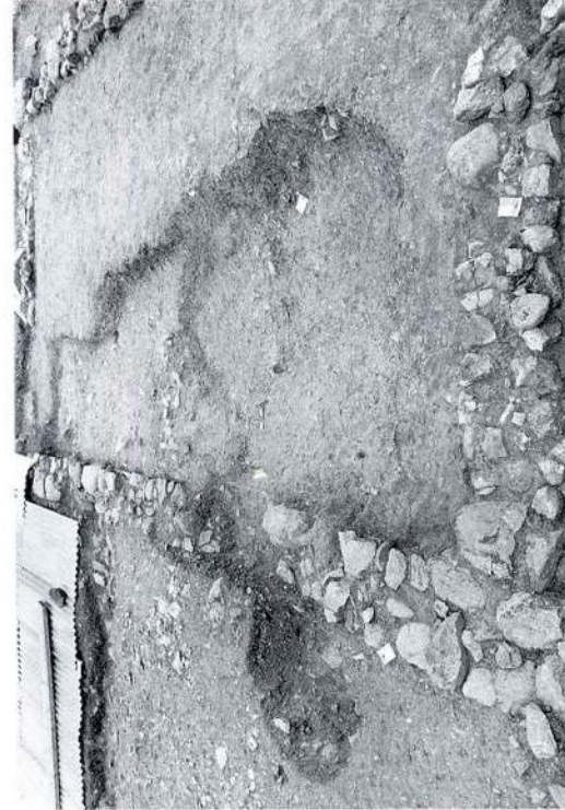
5. Οικόπεδο Κωστογλίδη. Ο χώρος Δ με υπολείμματα του αρχαίου στρώματος καταστροφής «κατά χόρταν». 6. Κυκλική κατασκευή στα ανατολικά του αρχαίου οικοδομήματος. 7. Ο χώρος Ε με ανασκαμμένο το λάκκο της εποχής της Τουρκοκρατίας. 8. Ο χώρος Δ. Πυρά της εποχής της Τουρκοκρατίας.