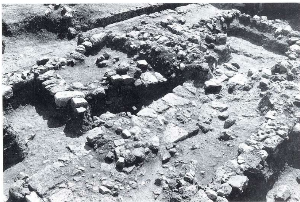
Βεργίνα. Απόψεις της ανασκαφής στα βορειοδυτικά της πόλης.