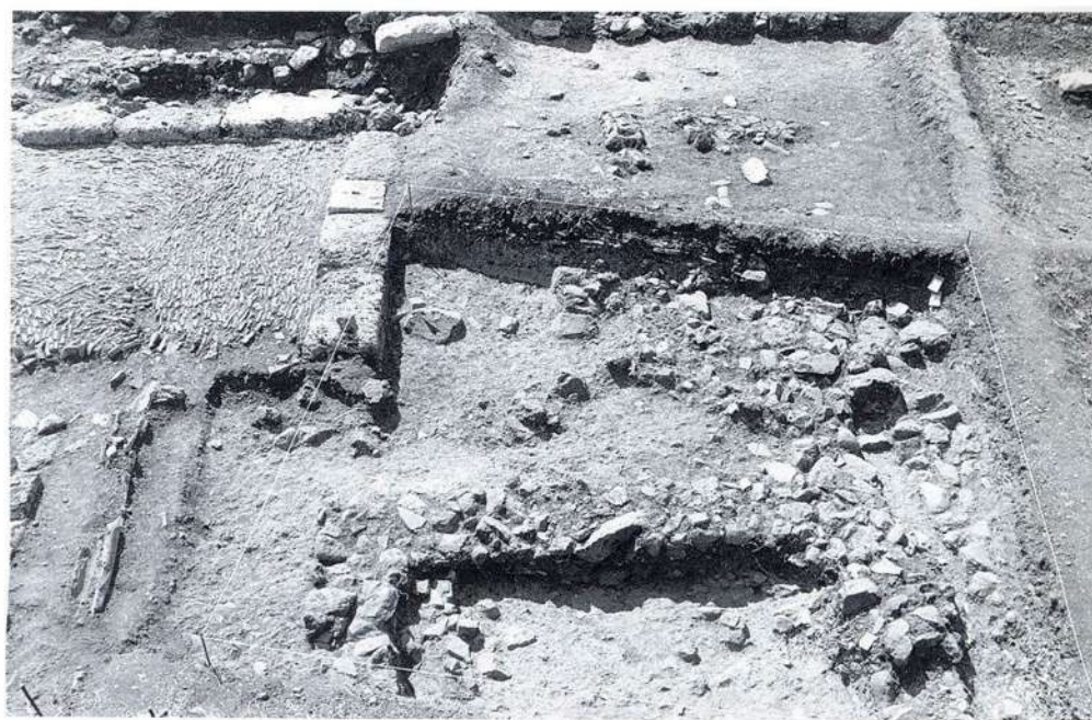
Βεργίνα. Απόψεις της ανασκαφής στα βορειοδυτικά της πόλης.